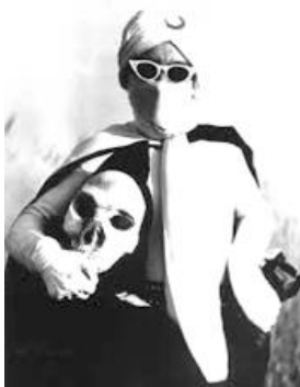
月光仮面とドクロ仮面

作である。ゴジラが東京を襲うとき、銀座の輝くネオンが映る。そのネオン広告の独壇場が、広告代理店宣弘社であった。大阪戎橋、博多の中州のネオンもそうである。国鉄の駅の装飾美化広告を兼ねた仕事も宣弘社、上野駅のコンコース、猪熊弦一郎の大壁画「自由」も手がけている。宣弘社は、独自に国産初のテレビ映画、『月光仮面』を製作する宣弘社プロダクションを設立した。『月光仮面』から『隠密剣士』、『ウルトラQ』、『ウルトラマン』、『柔道一直線』など子供たちに強烈な記憶を