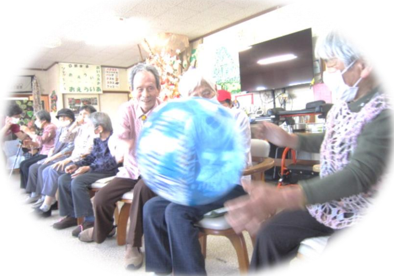
ボール送りリレーの様子

玉入れでは籠にたくさん玉が入るたび、歓声が上がリ、ボール送りでは後ろに送ったり、横並びで送ったりと大きく身体を動かしながら笑顔で楽しまれていました。