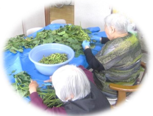
葉とり、豆採り作業をする利用者

またデイサービス利用のご家族から、黒豆枝豆のご寄付もいただきました。利用者に葉とり・豆採りを手伝ってもらって、おやつの時間に美味しくいただきました。ありがとうございました。