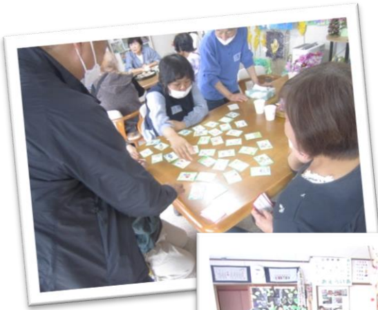
↑魚の漢字カードを使った文字合わせ